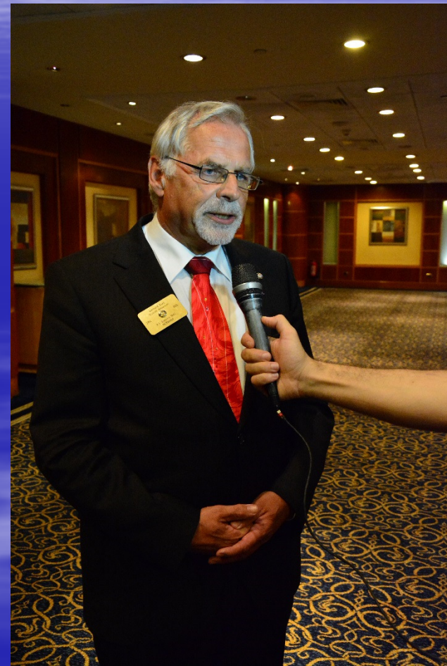
TV Interview PDG Zierl