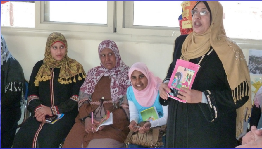
Unterricht nach der CLT Methode