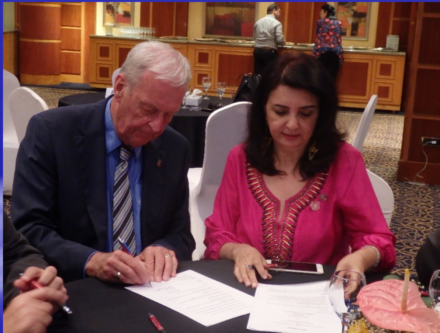
Unterzeichnung des Projektagreement 2015