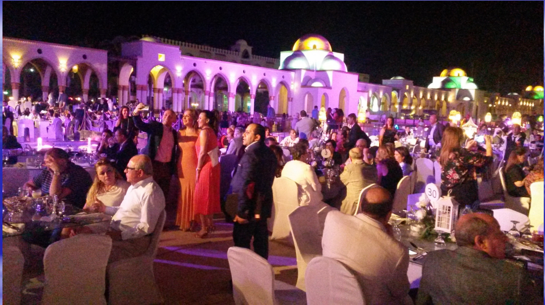
Abschlussabend der Distriktkonferenz D 2451 in Hurghada 2017