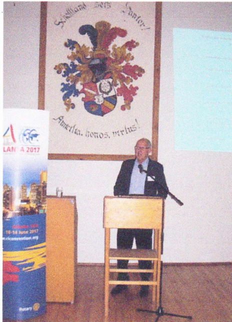
Philosoph Otfried Höffe beim Vortrag