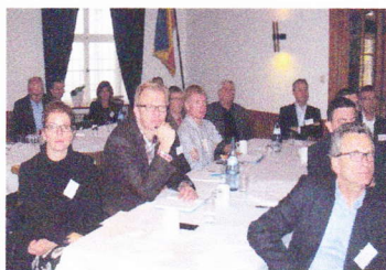
Aufmerksame Zuhörer bei den Beiträgen zum Thema Wasser

Kostbare Tropfen bewegten die Teilnehmer - Wasser. Zur Sprache kam alles rings um Philosophie, Projekte und Fördermöglichkeiten.