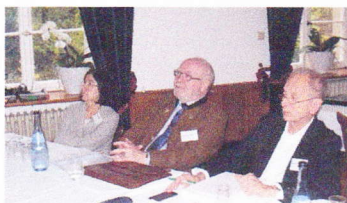
Welche Projekte laufen in den Clubs gut? - Es gab viel über nachahmenswerte Beispiele zu erfahren

Das Treffen war ganz dem Thema Wasser gewidmet, das sich der Distrikt zur Aufgabe gemacht hat. Die Gewinnung von sauberem Trinkwasser sowie die Abwasserbehandlung im Besonderen werden in den nächsten Jahren auf allen Kontinenten zu einem zentralen Problem. Beginnend mit tief sinnigen Betrachtungen über die Geburt der Philosophie aus dem Wasser erfreute Rotarier Otfried Höffe vom RC Reutlingen-Tübingen.