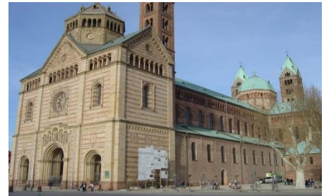
Dom zu Speyer

Geschichte: Der Kaiserdom steht in der Stadt Speyer und wurden von den Salier-Königen erbaut und ist heute die größte romanische Kirche der Welt. Seit 1981 steht der Dom auf der UNESCO-Liste des Weltkulturerbes.